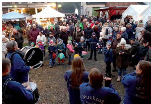
Begleitet von Musikzug und Freiwilliger Feuerwehr versammeln sich mehrere Hundert Gäste zum Laternenumzug. Anschließend gab es leckeren Grünkohltopf.

Der Erlös des Marktes ging an vier Sander Kindertagesstätten.